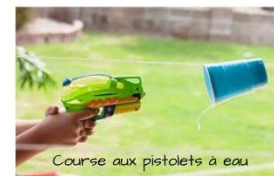
Course aux pistolets à eau